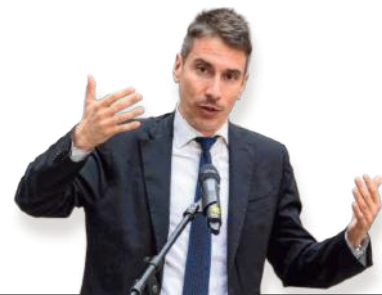
Egyptoloog Christian Greco