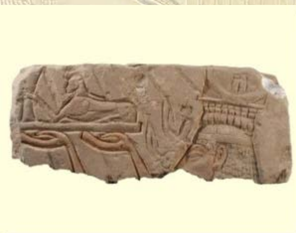
Nefertiti offert een sfinx