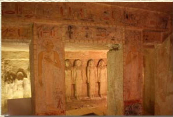
Mastaba Meresanch III