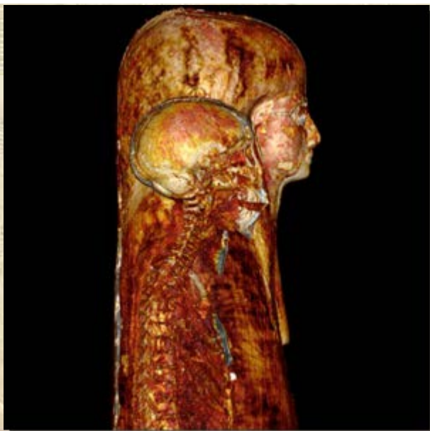
Mummie CT scan