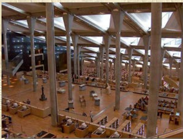
Internationale Congres van Egyptologen

De deksel is van een mummiekist van een anonieme hoogwaardigheidsbekleder uit de 16de dynastie (Tweede Tussenperiode). Ondanks dat de deksel in tweeën is gebroken, is het toch goed bewaard gebleven. De twee delen zullen binnen twee weken vanuit Israël naar Egypte terugkeren waar ze gerestaureerd worden in het Egyptisch Museum in Caïro, alvorens het geheel zal worden tentoongesteld.