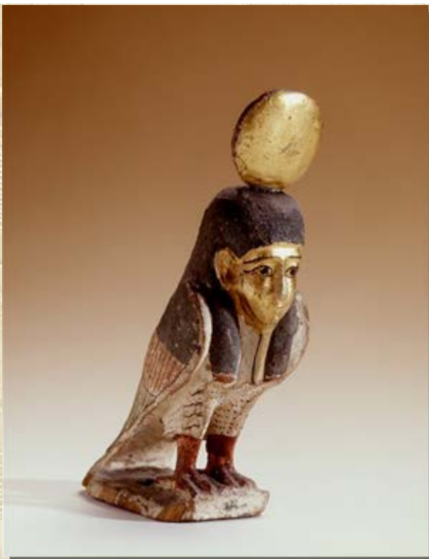
Rondleiding RMO Leiden