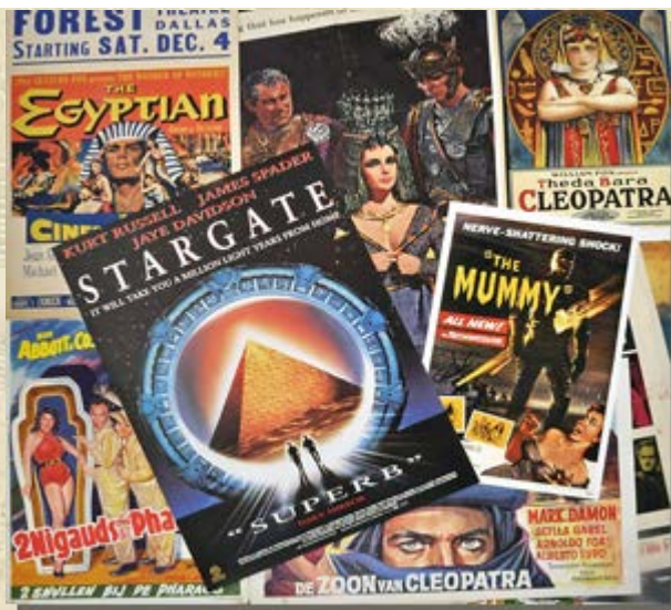
Lezing: Ontdekkingsreis van een verzamelaar