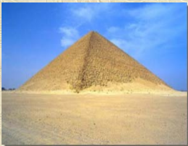
Rode piramide van Snofroe