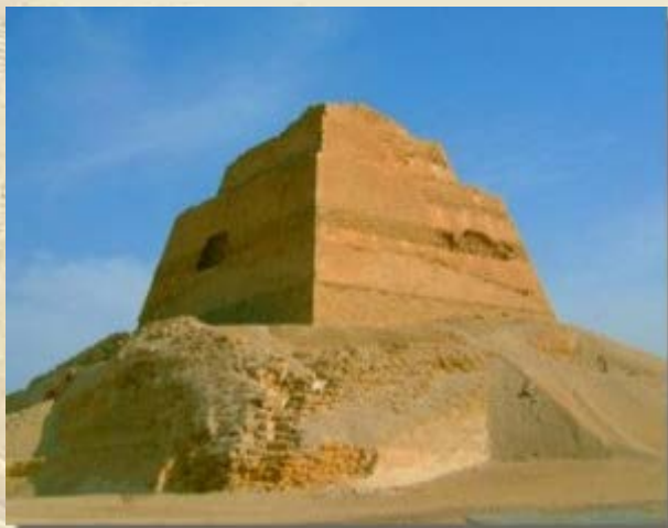
Reis Onbekend Egypte