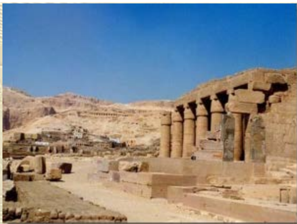
Cursus Onbekende Monumenten