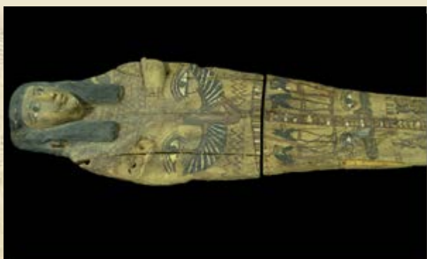
Deksel mummiekist uit Israël

gouwvorsten uit het Middenrijk, de gouwvorstgraven te Meir en Assioet, de aan de Thebaanse godin Moet gewijde tempel, de tempel voor de oorlogsgod Monthoe, de Qoernatempel van Sethi I, prachtige voorstellingen uit het dagelijks in de graven burgemeester Sennefer en vizier Rechmira, de trappenpiramide van El-Koela bij Kom el-Ahmar, de rotsinscripties in de Wadi Hammamat en de rotstempel van Horemheb.