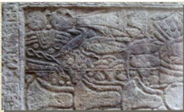
Stèle met offerlijst