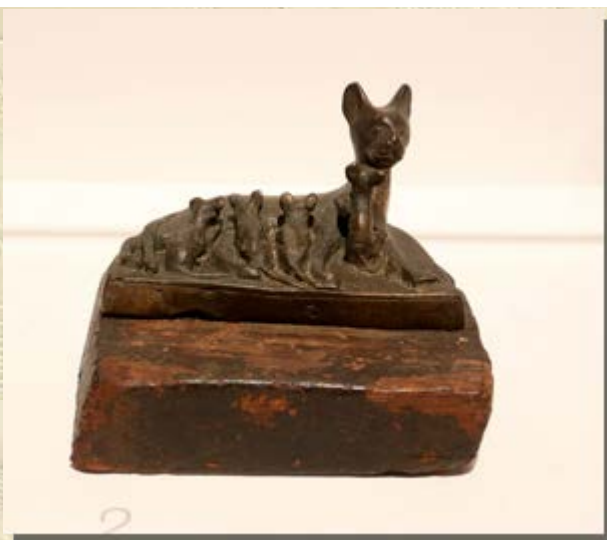
Devine Felines: Cats of Ancient Egypt