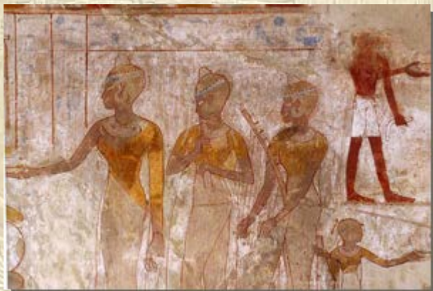
Schrijvers van Contouren

hebben een ravage aangericht in het museum. Vele honderden objecten zijn gestolen. De grote objecten die ze niet mee konden nemen zijn omver gegooid of op een andere manier beschadigd. Toen de politie hen wilden stoppen werd die beschoten door een groep volwassen mannen die de leiding leken te hebben genomen. Na afloop kondigden de autoriteiten aan dat mensen die gestolen objecten terug zouden brengen niet bestraft zouden worden. Zelfs een kleine geldelijke beloning werd in het vooruitzicht gesteld. Deze maatregel heeft enige vruchten afgeworpen. In de weken die volgden is een aantal objecten teruggebracht. Vele honderden museumstukken ontbreken echter nog steeds. Lees een selectie van de vele berichten: