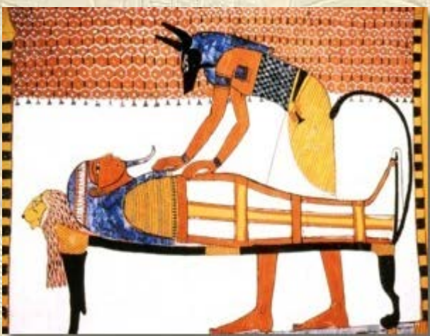
Cursus 'Egyptische Grafschilderingen'