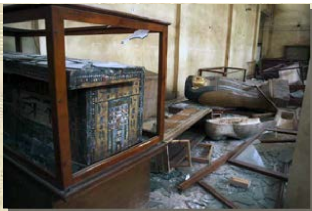
De ravage in het Malawi Museum