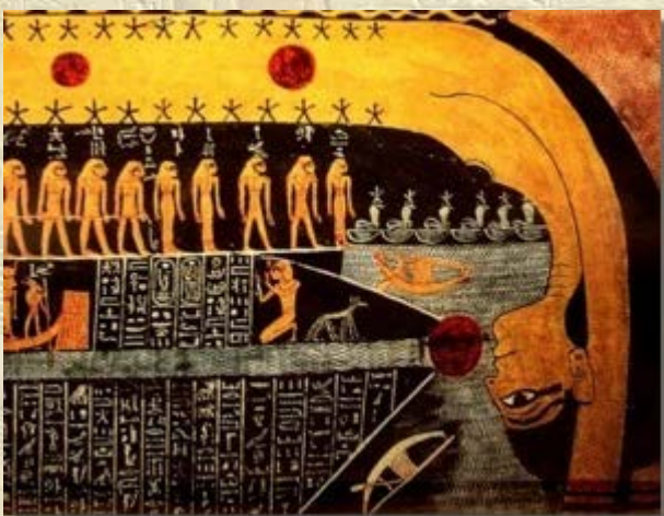
Cursus 'De Nachtelijke Hemelreis'

Late Tijd. Dit was in de 6de eeuw v.Chr..