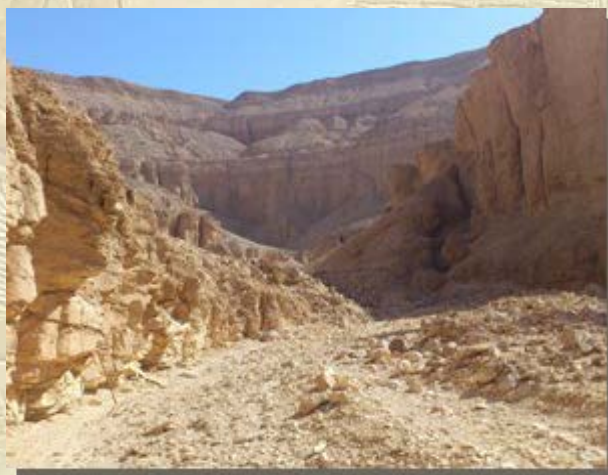
Reis 'Thebaanse Wadi's'

De drieduizend jaar oude mummiekisten van de Amon-priesters uit Thebe staan centraal in deze tentoonstelling. U maakt kennis met deze dienaren van de god Amon. U ontdekt hoe hun leven eruit zag en welke belangrijke rituelen plaatsvonden rond hun dood en begrafenis. Bijzondere aandacht is er voor de actuele restauratie van de kisten, een samenwerking met de Vaticaanse Musea en het Louvre. Elke week kunt u de restauratoren aan het werk zien in het museum: info .