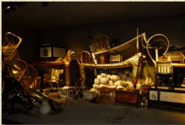
Toetanchamon Amsterdam Expo