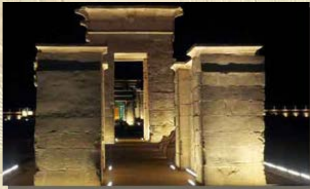
Hibis tempel Kharga Oase