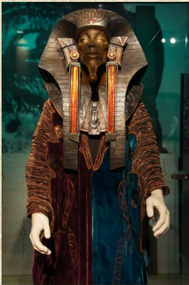
Beeldvorming historische film

farao aangetroffen. Op stijlkenmerken kan het beeld geplaatst worden in het Nieuwe Rijk. Het werk op de site gaat door in de hoop nog meer fragmenten van het beeld te vinden.