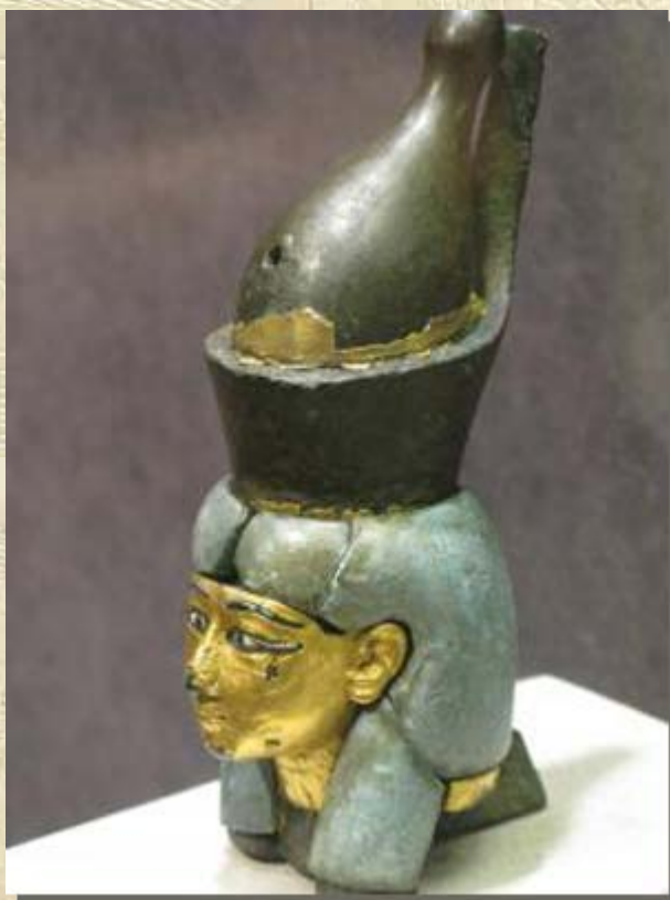
Moet, meesteres van Isjeroe