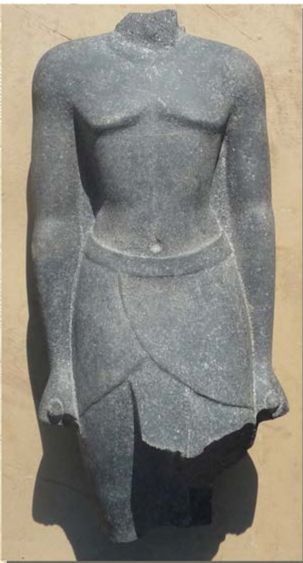
Koninklijk beeld Armant