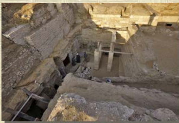
Voorhof graf Sjeretneby

voor de cultus in de Egyptische tempels vandaan kwamen. Niet alleen goud en wierook, maar ook struisvogelveren, ebbenhout en ivoor werd in groots opgezette expedities uit Nubië gehaald. De Nubiërs zelf stonden daarnaast bekend om hun vaardigheden als boogschutters en werden vaak ingelijfd in het Egyptische leger. Door onderlinge twisten tussen verschillende koningshuizen was de politieke situatie van Egypte in de 8ste eeuw v.Chr. erg instabiel. Als stichter van de 25ste dynastie wist de zwarte farao Kasjta rond 770 v.Chr. het verzwakte Egypte voor een deel te veroveren. De grote doorbraak kwam echter met de zwarte farao Taharka die Egypte in zijn geheel met Nubië wist te verenigen. Taharka liet een tempel bouwen in Kawa, een plaats bij de derde stroomversnelling in de Nijl in het huidige Noord-Soedan. Hij greep in zijn bouwplannen terug op Egyptische motieven uit het Oude Rijk. Taharka bouwde ook in andere plaatsen in Nubië zoals Napata, Sanam, Meroë en Boehen, maar ook in Egypte zelf. In het oude Thebe, het huidige Loeksor, liet hij een imposante barkkapel plaatsen voor de tempel van Amon te Karnak. De zwarte farao's van de 25ste dynastie regeerden over het machtige Egyptische wereldrijk vanuit hun zuidelijke stad Napata, bij de vierde stroomversnelling in de Nijl.