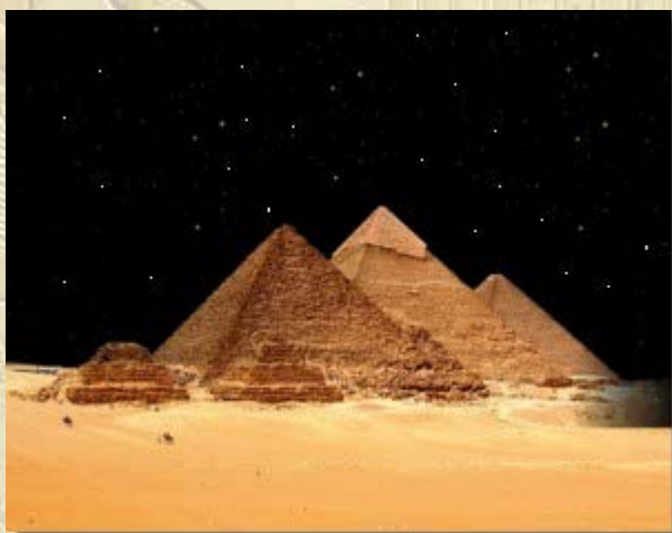
De Sterren boven Egypte