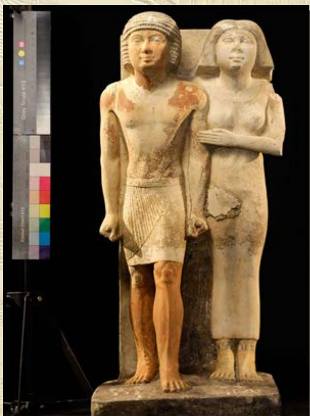
Beeld uit tombe Irti

tentoonstelling heeft samengesteld. Het Oude Egypte mag zich in een constante populariteit verheugen. Dit komt niet alleen tot uiting in de bezoekersaantallen van Egyptische collecties in musea, maar zeker ook in populaire fictie, in televisieproducties en vooral in films. Wie kent nou niet de Cleopatra-verfilming met Liz Taylor, die enge mummiefilms uit de jaren veertig en late jaren negentig, of het verhaal van Mozes en de bijbelse exodus uit Egypte in The Ten Commandments (1956) of The Prince of Egypt (1998)? In totaal zijn er sinds het ontstaan van de film meer dan 300 films gemaakt waarin het Oude Egypte een rol speelt. Van kleine films met goedkope kostuums en quasi-Egyptische voorwerpen tot grootschalige producties met een sfeer van epische grandeur. Wat telt is in de meeste gevallen niet de 'saai' historische juistheid, maar wat op het grote doek goed oogt. Feitelijk krijgen we dat te zien wat we van Egypte verwachtten te zien. Aan de hand van vier verschillende films wordt ingegaan op de typische kenmerken van dit soort historische filmproducties.