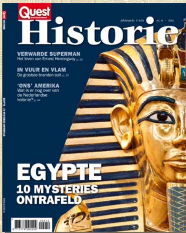
Quest december 2012