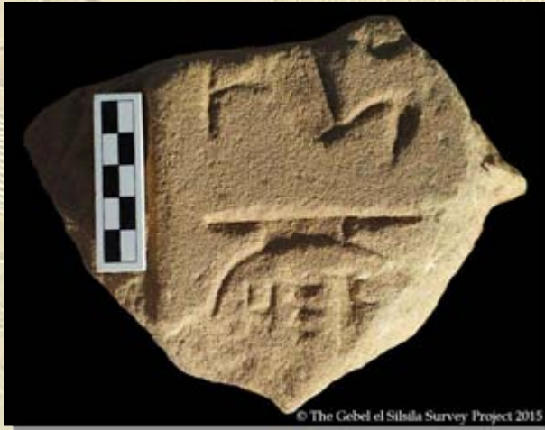
Vondst tempel Gebel el-Silsila