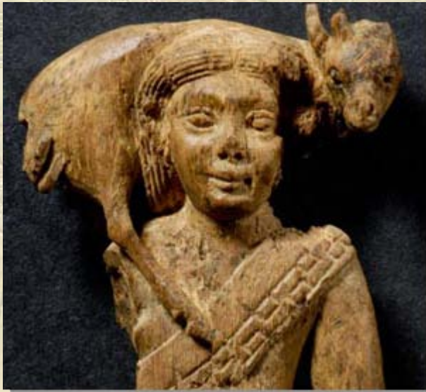
Beeldje man met gazelle

beeldje, wat van ivoor is gemaakt en een man voorstelt met een gazelle op zijn schouders, terug te laten keren naar Egypte. Lees het hele artikel: Unique stolen ancient Egyptian statue to return from Germany soon