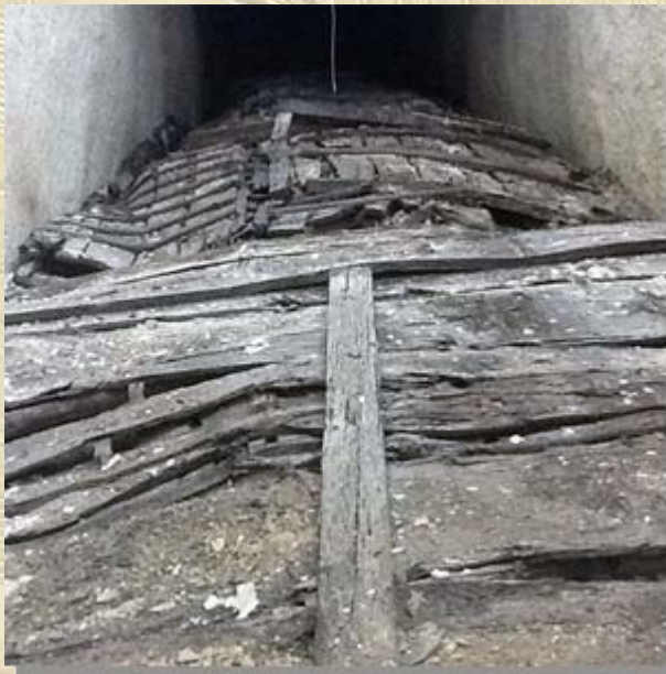
Balken zonneboot Choefoe

beeldje, wat van ivoor is gemaakt en een man voorstelt met een gazelle op zijn schouders, terug te laten keren naar Egypte. Lees het hele artikel: Unique stolen ancient Egyptian statue to return from Germany soon