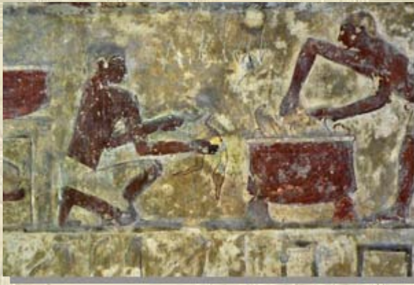
Wijnproductie graf Iymery Gizeh