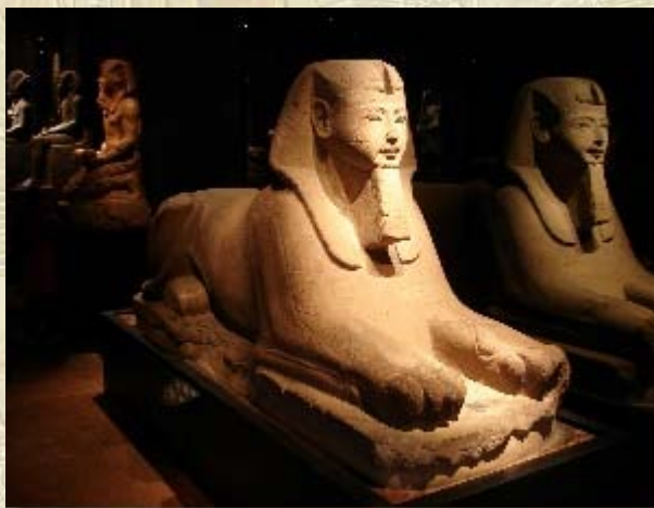
Reis naar Italië

In het Musée de la Civilisation in Québec, Canada, is van 27 mei 2015 t/m 10 april 2016 de tentoonstelling 'Egyptian Magic' te zien.