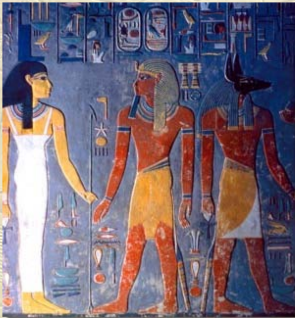
Reizen naar Egypte