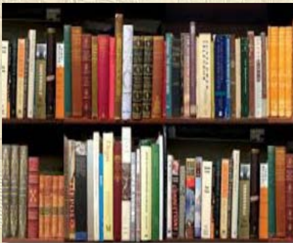
Webwinkel egyptologische boeken