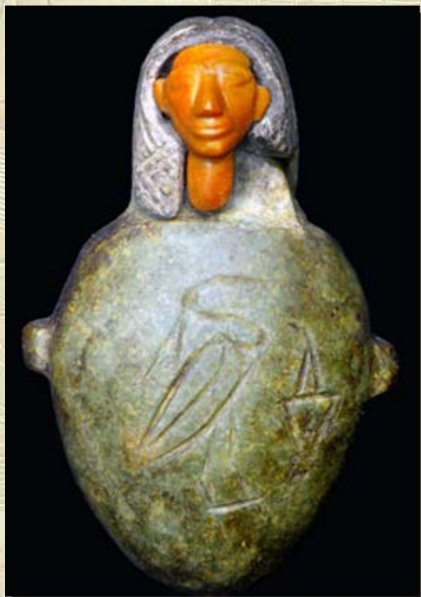
Jaspis hart-amulet gevonden in Abydos