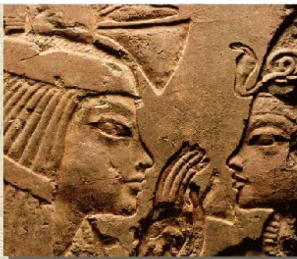
Summer School 'Sakkara'