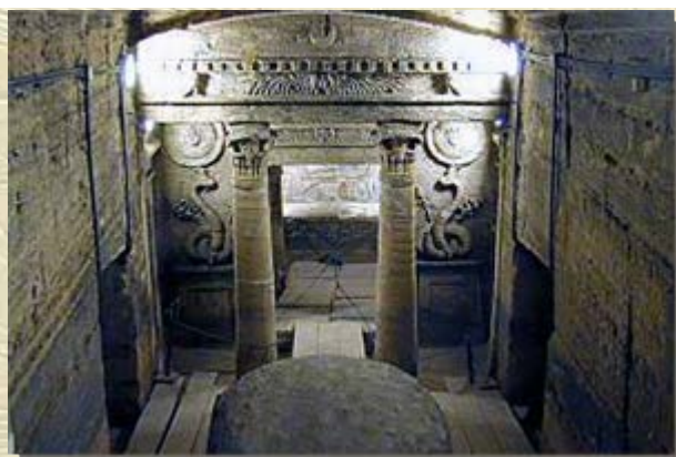
De catacomben van Kom es-Sjoeqafa