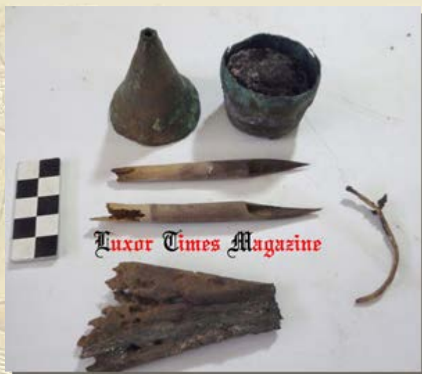
Schrijfgerei uit graf 26ste dynastie in Aboesir