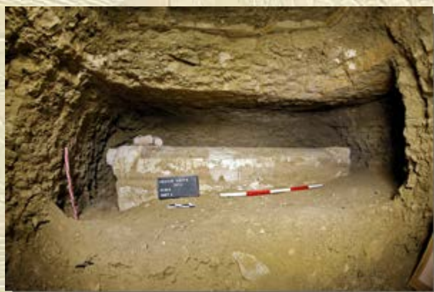
Graf van een hoge ambtenaar in Aboesir gevonden