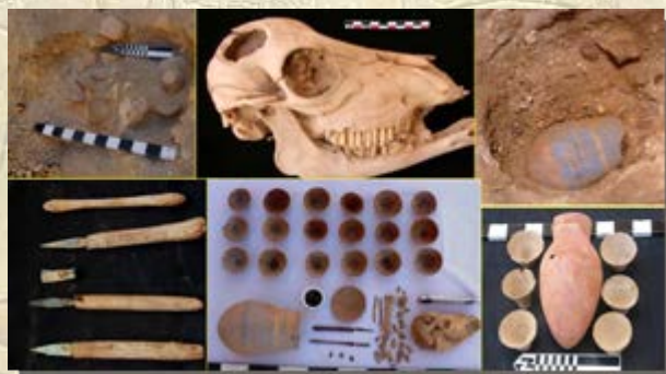
Voorwerpen uit de caches in het Dal der Koningen