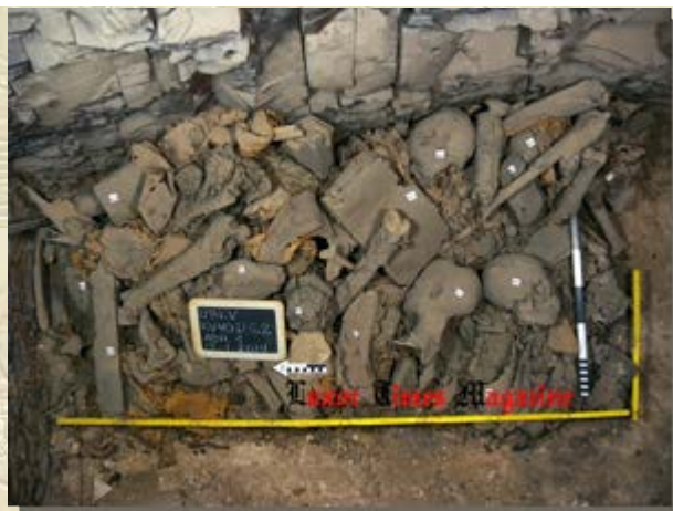
Deel van de inhoud van KV40