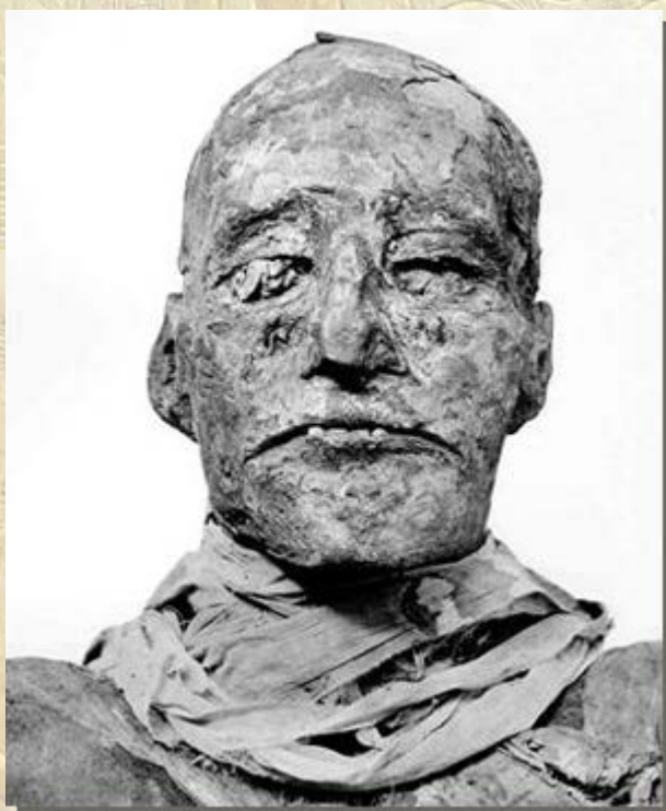
Mummie Ramses III