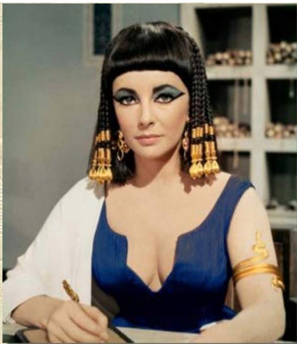
Masterclass en rondleiding 'Cleopatra'