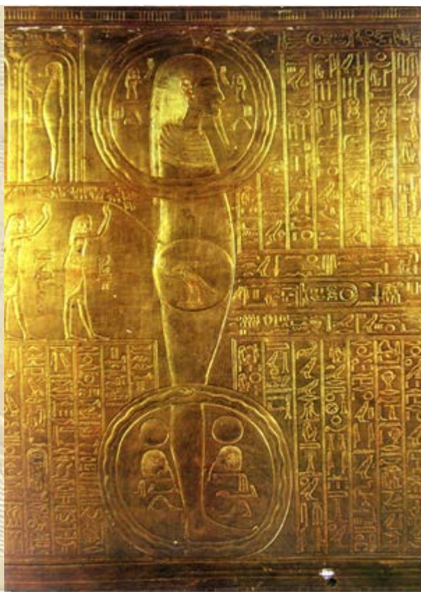
Cryptografie op de schrijnen van Toetanchamon