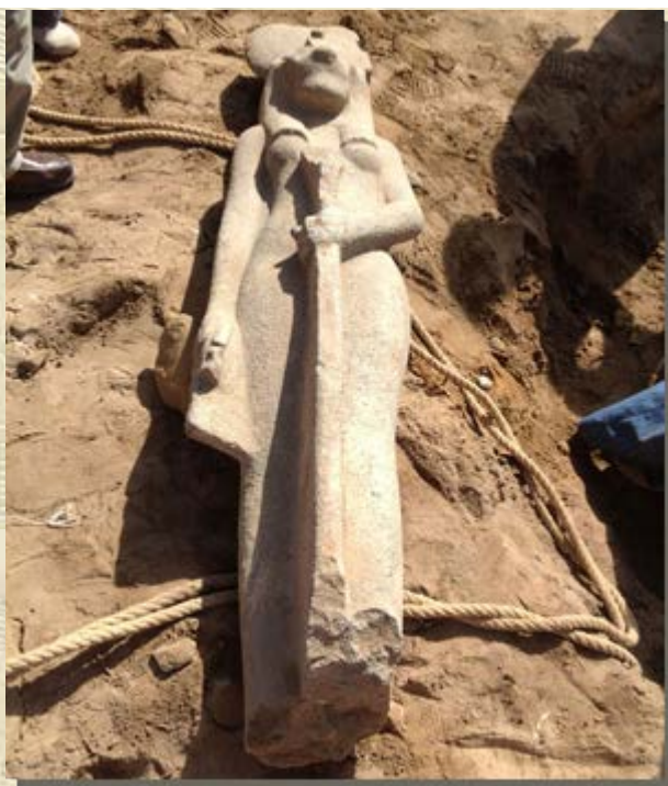
Sachmetbeeld in Moet tempel