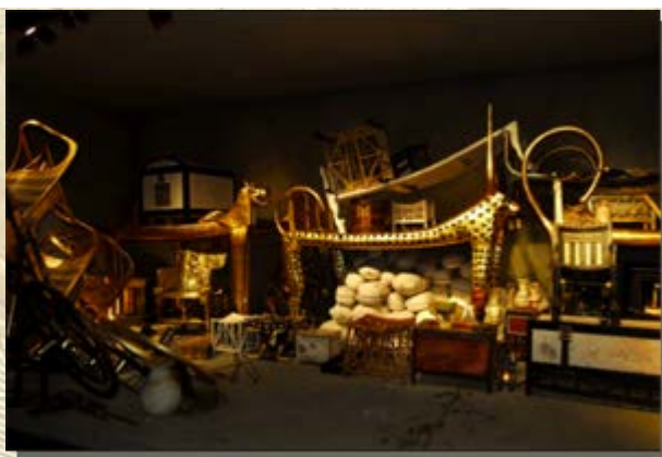
Toetanchamon Amsterdam Expo