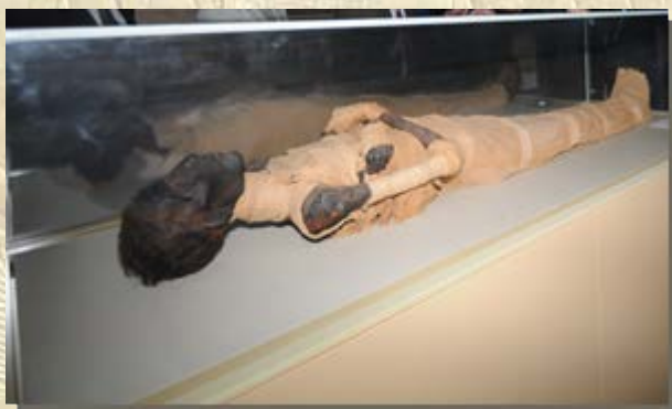
Mummie Amenhotep II