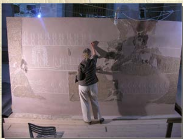
Buitenste sarcofaag van Merenptah

rassen er allemaal begraven zijn. Naast honden zijn er ook nog andere dierenmummies gevonden, namelijk van katten en mangoesten.