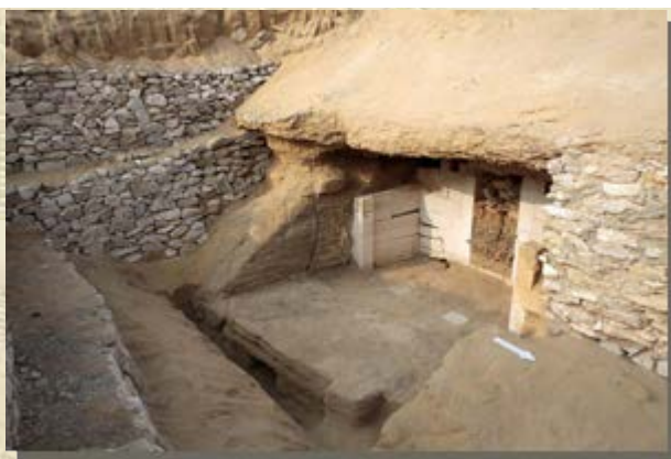
Graf van Ichi met bovendee van nieuw graf