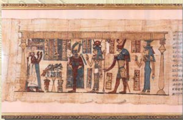
Papyrus in het Meermannuseum