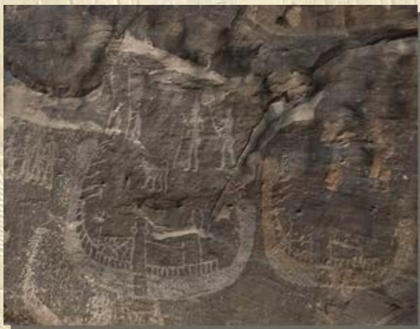
Oudste afbeelding farao