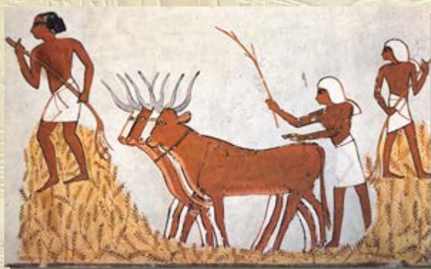
Van gerst tot broodtarwe

bijzondere Egyptische schat aan boord: info (Engels).