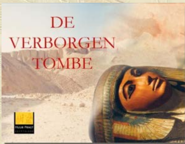
Boek 'De Verborgen Tombe'

In de Amsterdam Expo is vanaf 29 november 2012 tot en met 5 mei 2013 de tentoonstelling 'Toetanchamon, zijn graf en zijn schatten' te zien. Deze tentoonstelling over Toetanchamon is baanbrekend in haar presentatie van culturele geschiedenis in het algemeen en het Oude Egypte in het bijzonder. De tentoonstelling is een unieke reproductie van de kamers van de graftombe. De prachtige schatten worden tentoongesteld in de vorm van kwalitatief hoogwaardige replica's. Met meer dan 1000 voorwerpen -wetenschappelijk goedgekeurde, haarfijne replica's- op bijna 3000 m 2 is Toetanchamon, zijn graf en zijn schatten completer dan welke eerdere expositie van originele objecten dan ook. De replica's zijn van de hoogste kwaliteit en zeker de moeite waard om te gaan bekijken. Ga voor meer informatie en het bestellen van tickets naar de website van Amsterdam Expo .