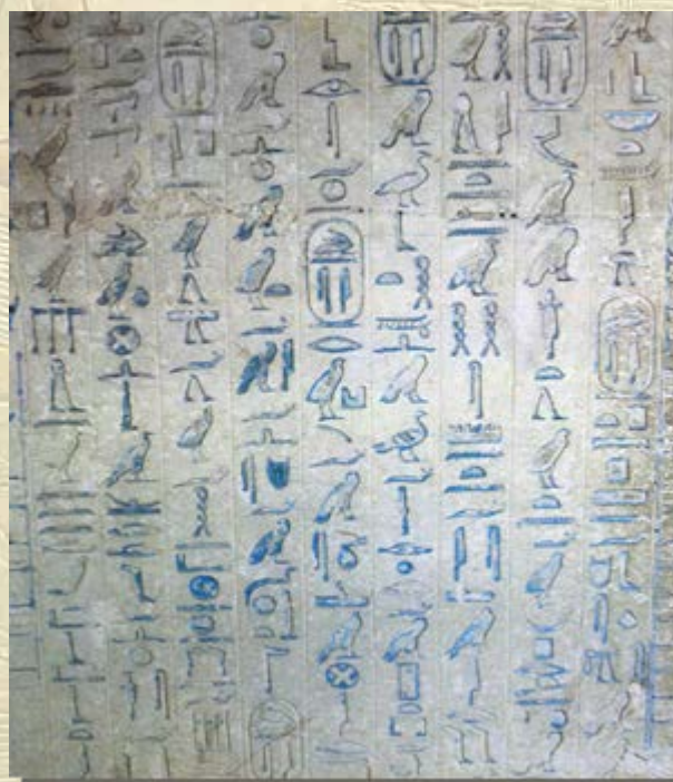
App die hiërogliefen kan herkennen

begraafplaats dateert uit de Nieuwe Steentijd, ongeveer 6500 jaar voor Christus. Nooit eerder is een begraafplaats gevonden die exclusief voor kinderen, baby's en foetussen was bedoeld. Er zijn geen bovenbouwstructuren gevonden en de meeste graven waren slechts ondiepe kuilen in de grond. Alle graven hadden slechts een paar kleine grafgoederen zoals armbanden van ivoor of schelpen. Elk graf bevatte wel stukjes rode oker, iets wat als heel belangrijk werd gezien. Lees het hele artikel: Neolithic child cemetery in Egypt .