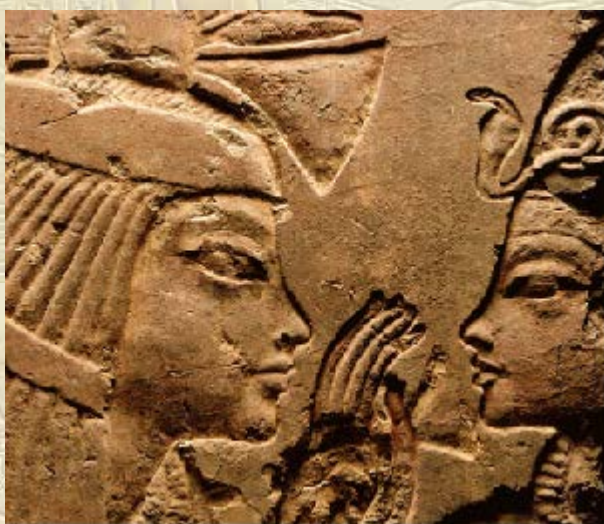
Summer School 'Sakkara, recent onderzoek'