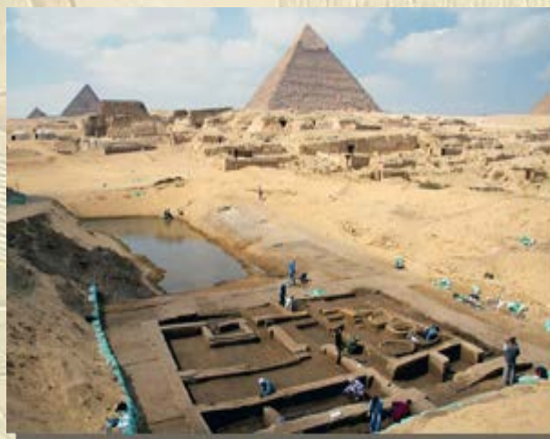
Priesterhuis in Gizeh