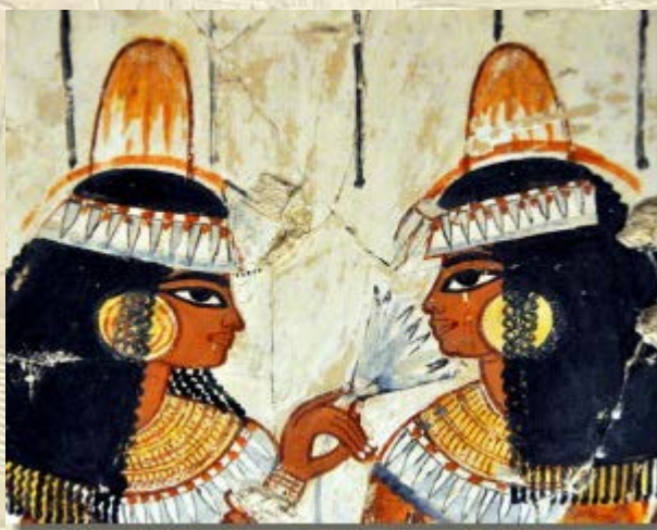
Masterclass 'Goddelijke Geuren'