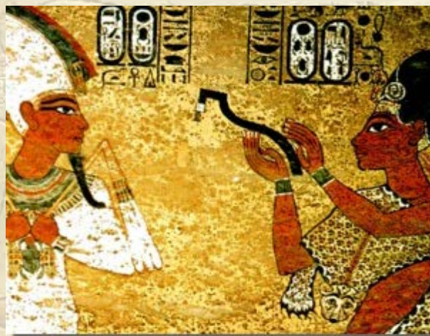
Lezing 'Begravenisrituelen in het Oude Egypte'

Lees het hele artikel: Findings at Giza Plateau en bekijk een aantal foto's .