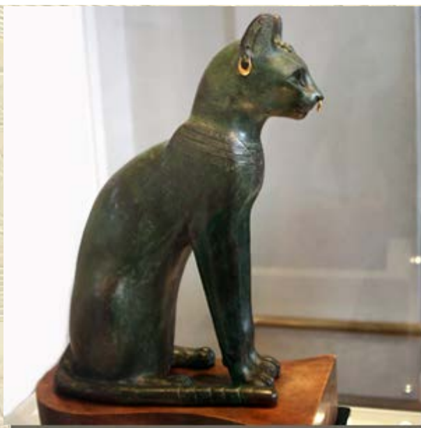
Lezing 'Katten in het Oude Egypte'