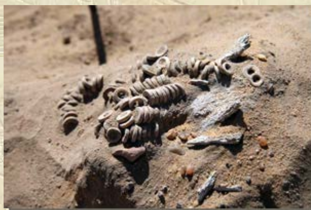
Kinderbegräafplaats Gebel Ramlah