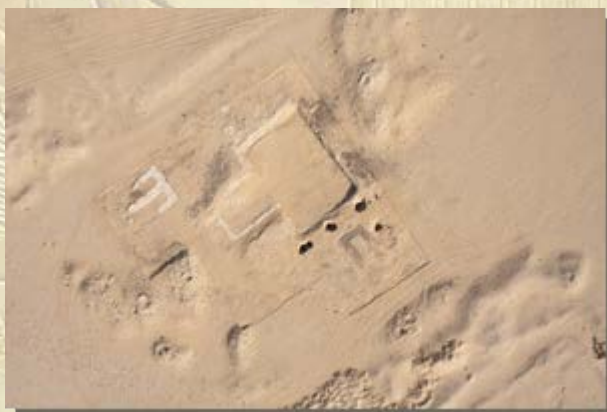
Amarna opgravingen 2012