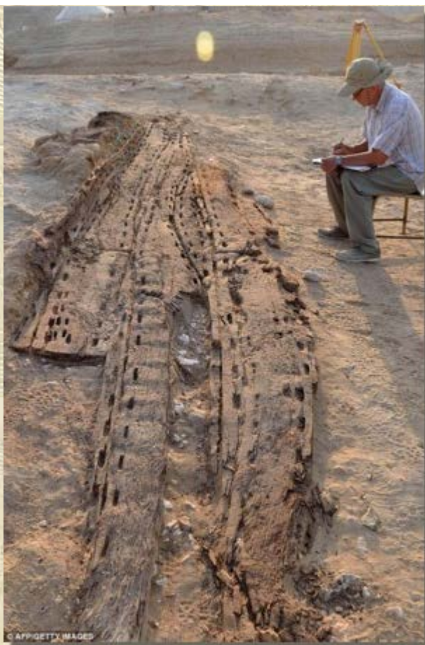
Zonneboot te Aboe Roasj