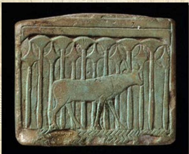
Tuinen van de Farao's

verbonden aan de Macquarie University in Sydney Australië), namens het Franse Archeologische Instituut, een heropgraving in dit gebied gestart met nu als resultaat de opzienbarende vondst van een houten zonneboot. Lees hier de Engelstalige artikelen via AhramOnline en via MailOnline .