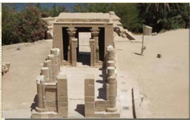
Hathor tempel op Philae