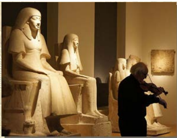
Nacht van de Viool