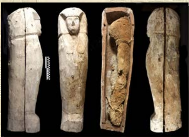
Mummiekist uit de 17de dynastie