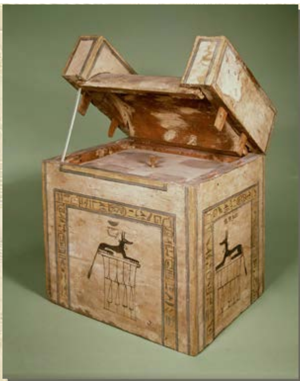
Rituelen rond de dood