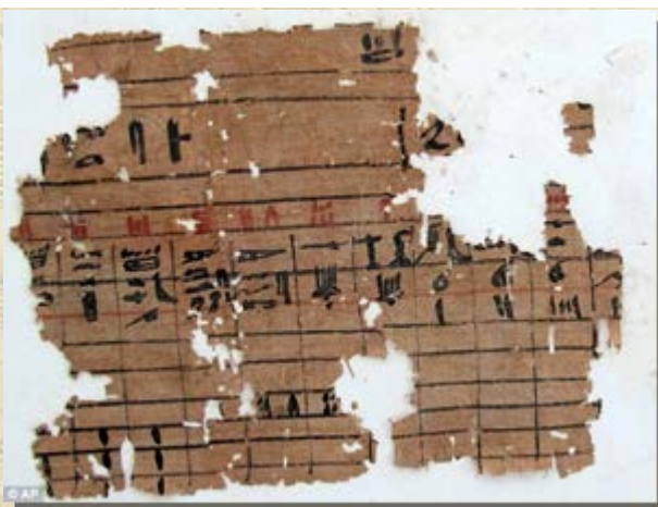
Papyrus uit de haven van Choefoe