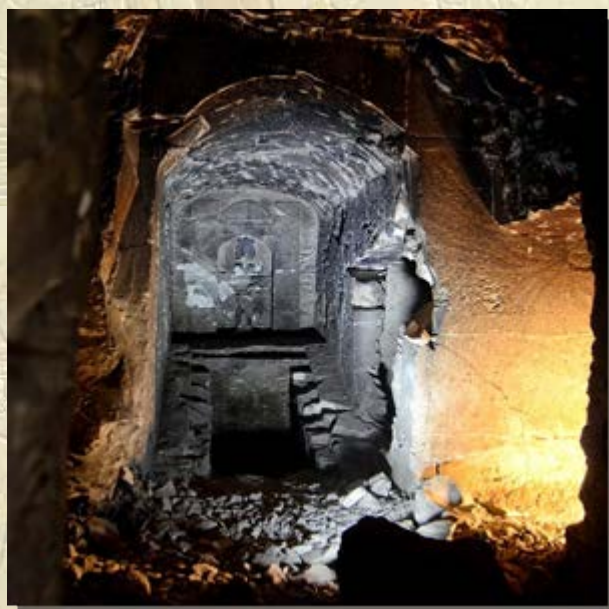
Osiris tombe Loeksor

titels 'Koninklijke Echtgenote' en 'Koningsmoeder'. Mogelijk is ze de vrouw van farao Neferefra, de vijfde koning van de 5de dynastie. Zij is vermoedelijk de moeder van Menkaoehor, de zevende koning van de 5de dynastie.