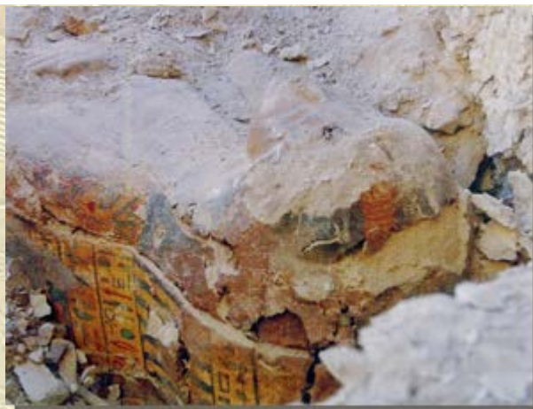
Mummiekist 'Zanger van Amon'