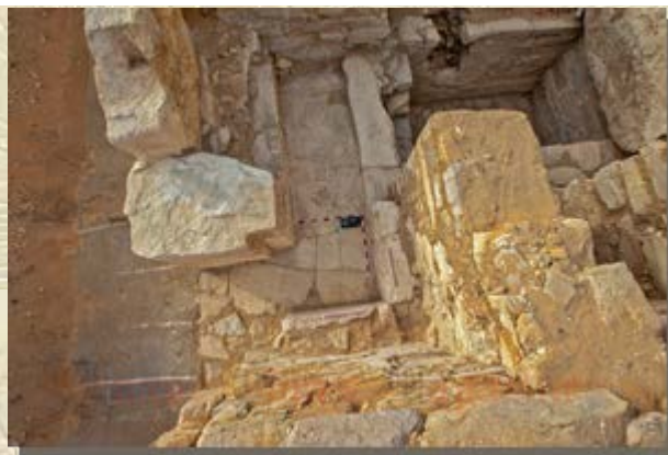
Tombe koningin Chentkaes III