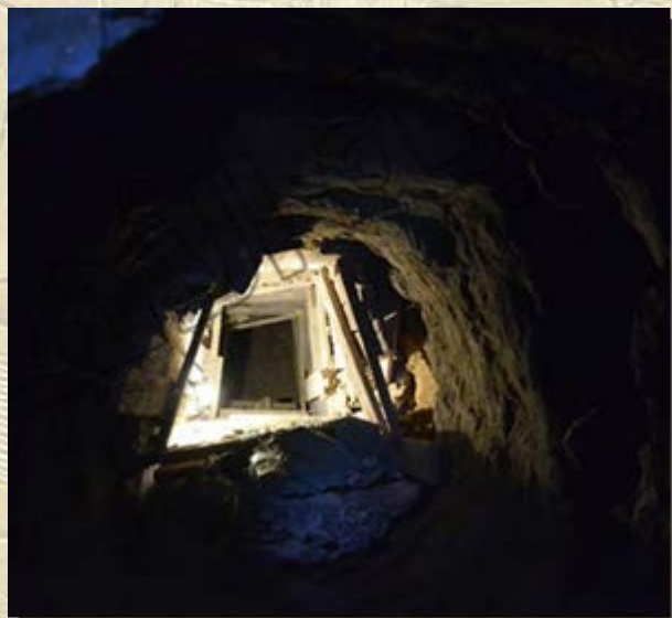
Processieweg van Choefoe