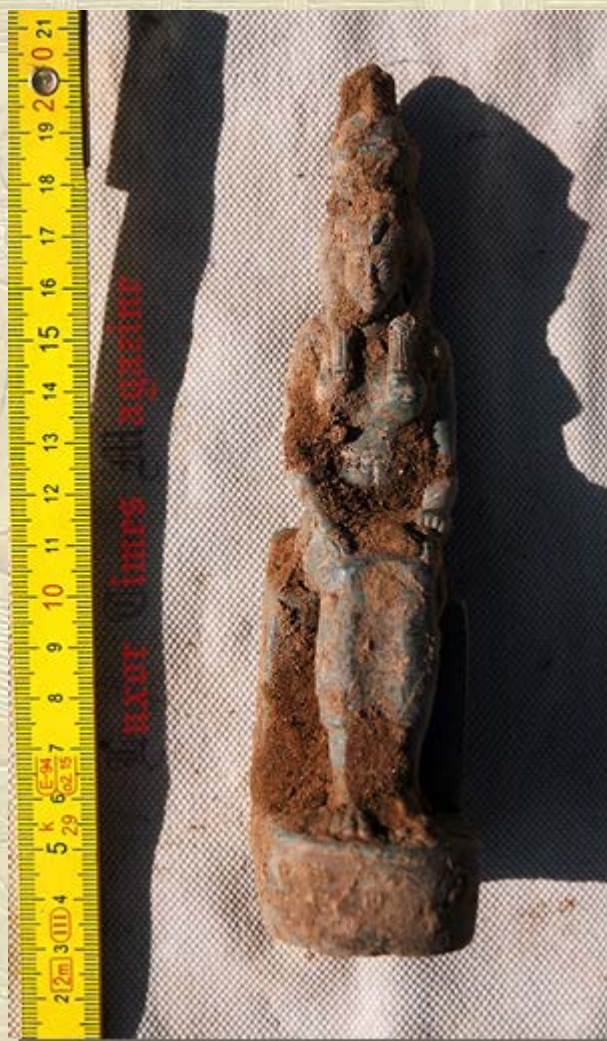
Beeldje godin Moet uit Karnak

genaamd 'Kampp-327' in Sjeich Abd el- Qoerna.