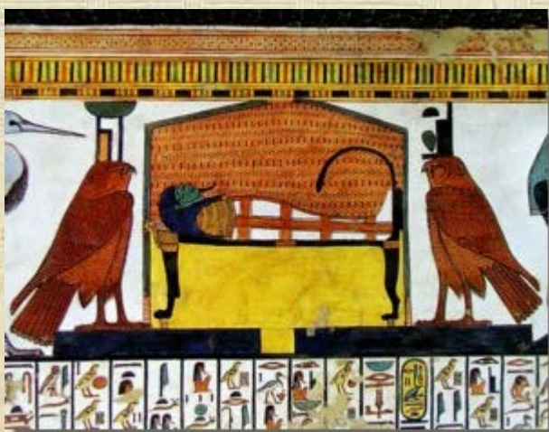
Reis: Faraonisch Egypte

omdat haar positie niet meteen duidelijk is. Vrouwen hadden minder carrièremogelijkheden dan mannen, maar toch waren er nog genoeg mogelijkheden voor hen. Tjat had de titel 'schatbewaarder van het eigendom van haar heer'. Deze titel was niet louter ceremonieel, maar omvatte wel degelijk de nodige werkzaamheden en het was een belangrijke positie.