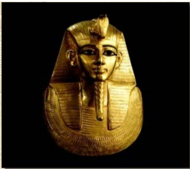
Cursus: Nadagen van een Gouden Tijdperk