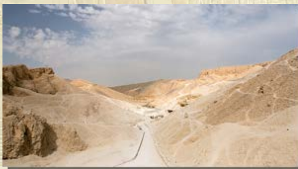
Dal der Koningen