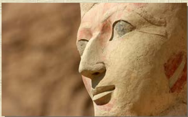
Biografie van Hatsjepsoet

potten bevatten redelijk tot goed bewaarde natuurlijk mummies van honden. De archeologen hebben honden de namen Houdini en Chewie gegeven. Houdini is zo genoemd, omdat de archeologen niet kunnen ontdekken hoe de Oude Egyptenaren de hond op deze manier in de pot hebben gekregen. De honden kunnen ook niet uit de potten worden gehaald zonder ze onherstelbaar te beschadigen.