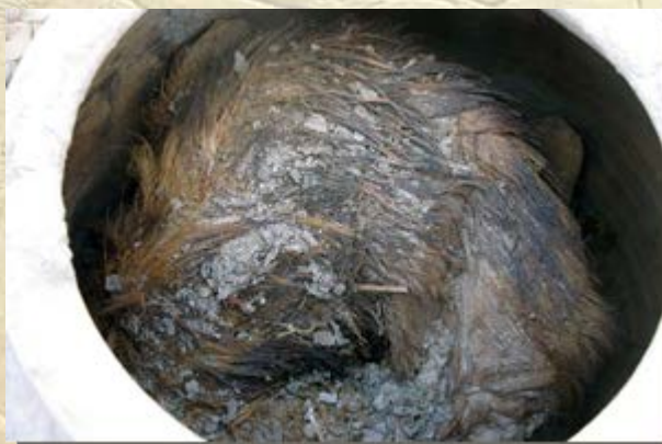
Honden begraven in potten

de Egyptische autoriteiten geen uitspraken. Het beeld stelt waarschijnlijk Anchesenpaäton voor. Zij zou later haar naam veranderen in Anchesenamun en werd de echtgenote van Toetanchamon. Naar verluidt heeft het beeld bij de bestorming van het museum beschadigingen opgelopen, maar kan het worden gerestaureerd. Lees het hele bericht: Tutankhamun's sister recovered