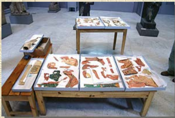
Leerwerk van een rijtuig