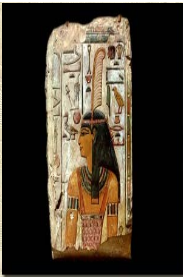
Summer School: Egyptologie in Italië