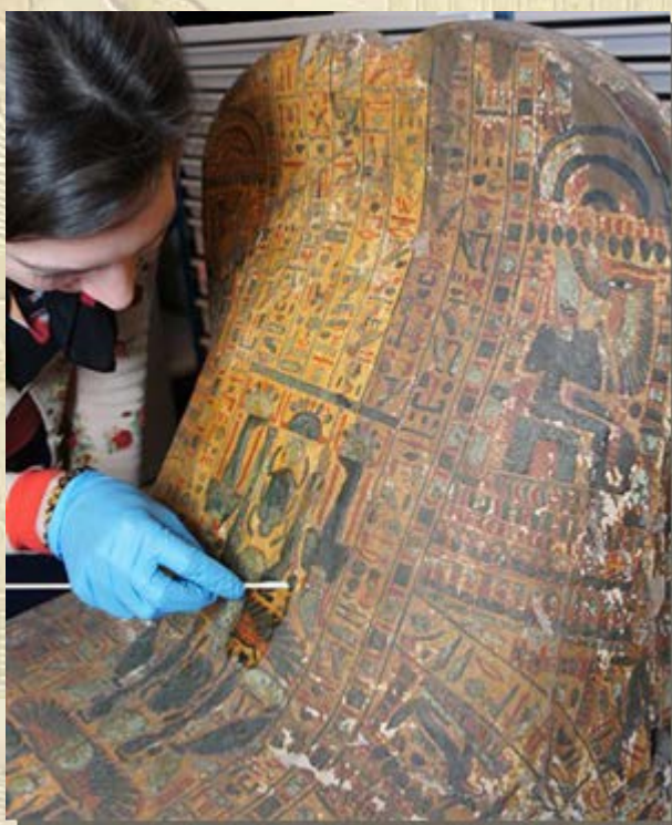
Mummiekisten van de Amonpriesters

keurig in een mummiekist zat, heeft hij schade opgelopen. Daarom is nog niet vast te stellen of het om een man of een vrouw gaat. Alleen dat het een volwassene is.