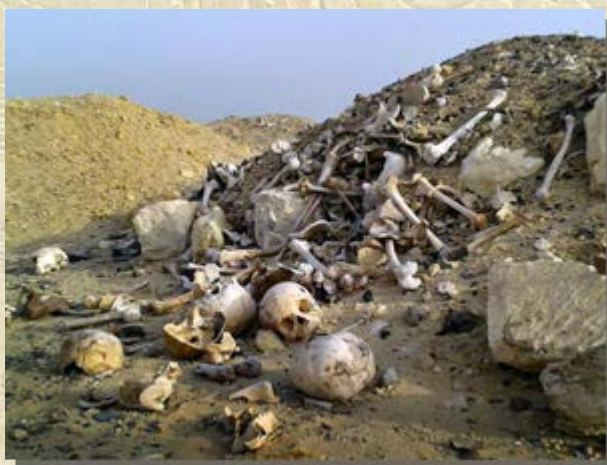
Plunderingen Abu Sir el-Malek