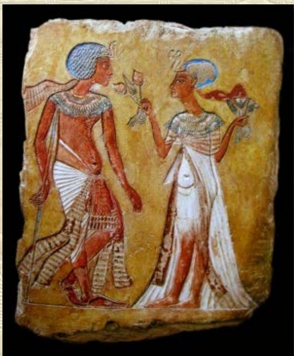
Summer School 2012