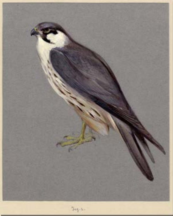
Valk geschilderd door Carter